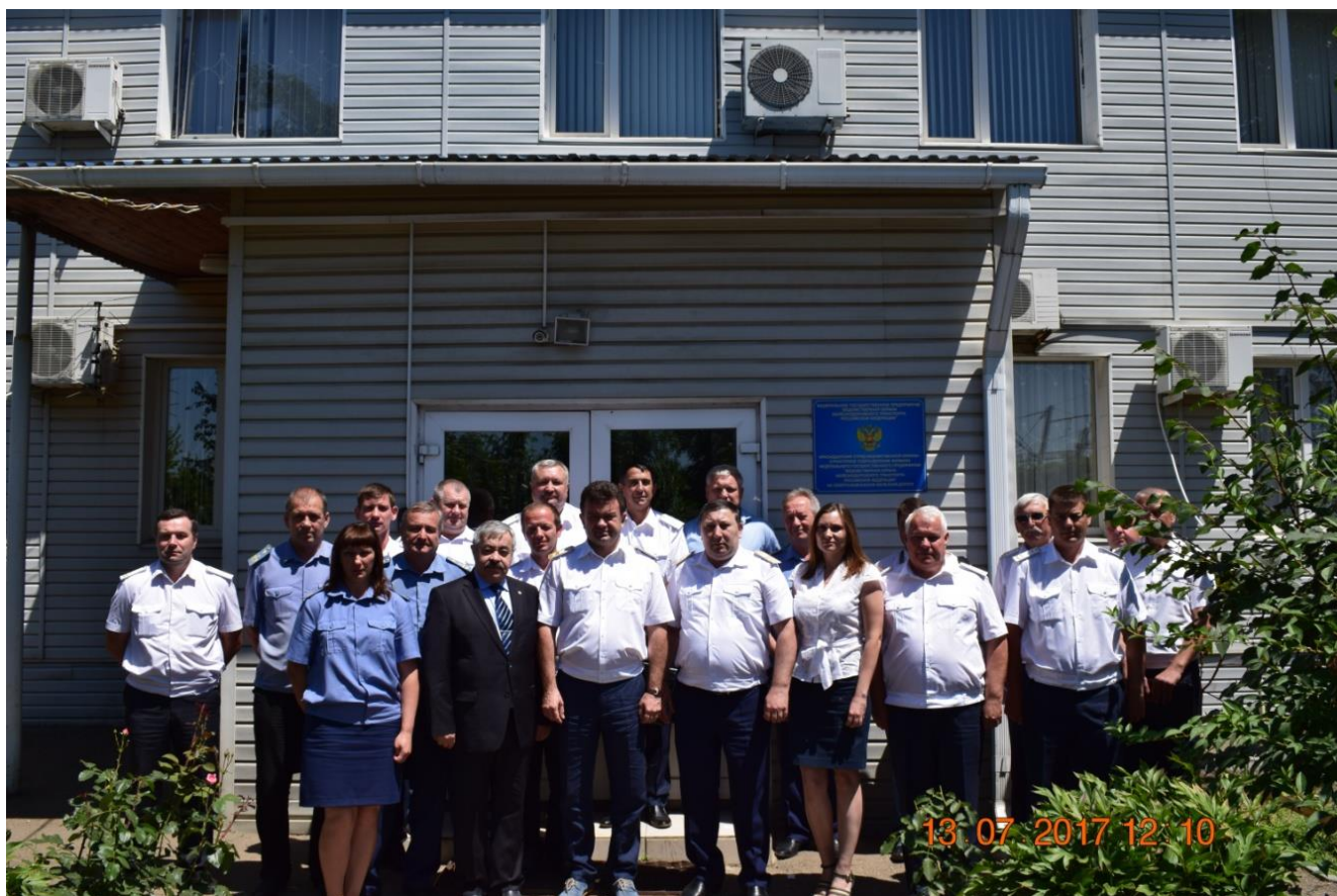
Рисунок 3. Общая фотография делегатов конференции.